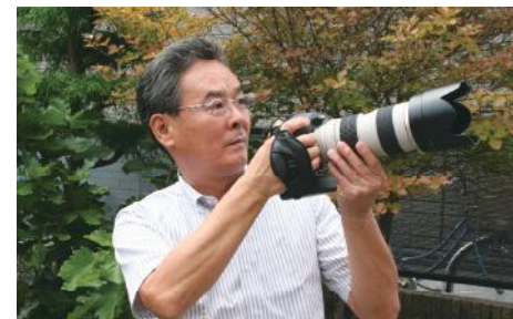
趣味はゴルフと写真。アパートのDIYもやりましたね。

何足のわらじかわからなくなるほどですね(笑)。精神的に活動されているのですね。私の年齢では周りの方から「若い」と言われるくらいです。まだまだです。これからしっかりやっています。趣味はゴルフと写真。アパートのDIYもやりましたね。