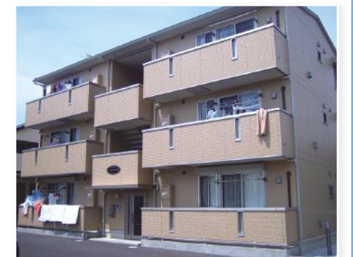
相模原市中央区千代田にダイワハウス『セジュールオッツリミテッド』の新築賃貸マンション4棟が完成しました。