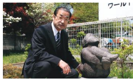
マンション入口のオブジェと共に