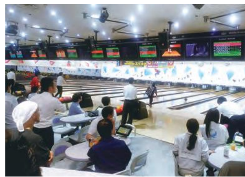
歓声が沸くボウリング大会

恒例となった親睦ボウリング大会 6月に協業業者の皆さまの親睦を目的に、毎年恒例となったボウリング大会を開催しました。会場のJR相模原駅前の相模原パークに約60名の協業業者が集まり、各レーンでは歓声が沸き、白熱したゲームが繰り広げられました。 大盛況のボウリング大会に続き、結果発表会&懇親会が行われ大いに盛り上がり、協業業者同士の親睦を深めることができました。今後も協力会では、親睦と絆を深め、一致団結して業務に取り組んでまいります。