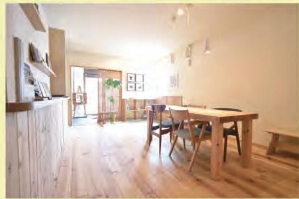
弊社、打合せ室：天井と壁をスタッコウォール仕上げ

天然素材にこだわった塗り壁材。ドイツ製の「天然ミネラルファイバー」を加え、材料の強度を大幅に向上させました。スタイルに合わせてカラーバリエーションは基本30色をご用意しております。