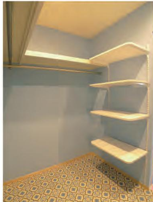
ウォークインクローゼット内部① 入口横には可動式の収納棚。壁紙とクッションフロアを選ばれた奥様。センスが感じられてとても素敵ですね。

2世帯仕様になっている1階のダイニングキッチンと和室を広い寝室と、収納量が自慢のウォークインクローゼット、ご主人の書斎（パソコン室）へ改修致しました。また、器用なご主人が天井と壁の珞藻土（スタッコウォール）仕上げをする参加型リフォーム工事となりました。