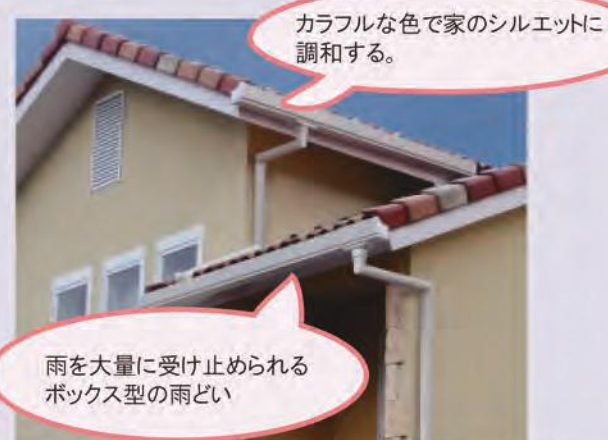
雨を大量に受け止められるボックス型の雨どい

最近の雨どいは、雨の重みや風で物がぶつかっても壊れない丈夫なものが増えていきます。大雨を受け止められる大容量の雨どいも多くなっています。洋風建築にも合うベージュやブラウン色や様々な形状や質感があるのも嬉しいですね。新しい雨どいで、大雨に備えるのと同時に家の外観もリフレッシュしてみませんか。