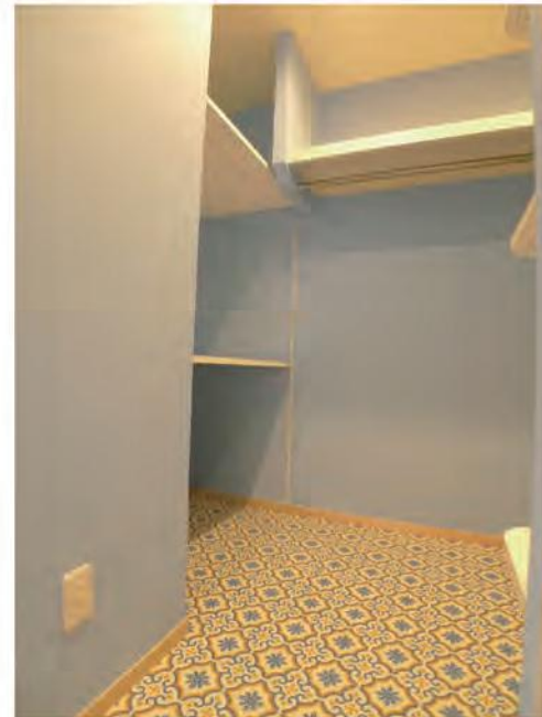
ウォークインクローゼット内部② ハンガータイプのパイプ収納とお布団がしまえる奥行きある収納がスペースを有効活用しています。