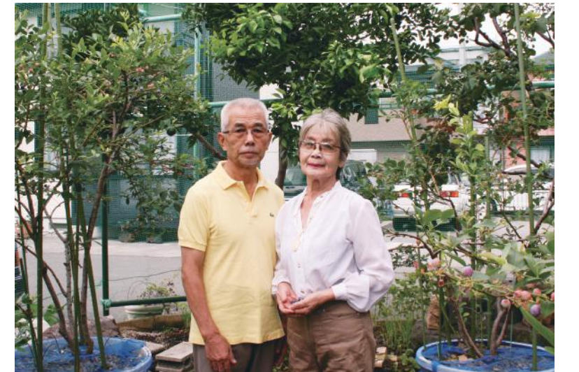
家庭菜園で奥様と一緒に

営業さんからアドバイスを受けて設置しています。室内照明もこだわったものになっています。人気の設備が勢ぞろいしています。入居者さんにも好評ですよ。