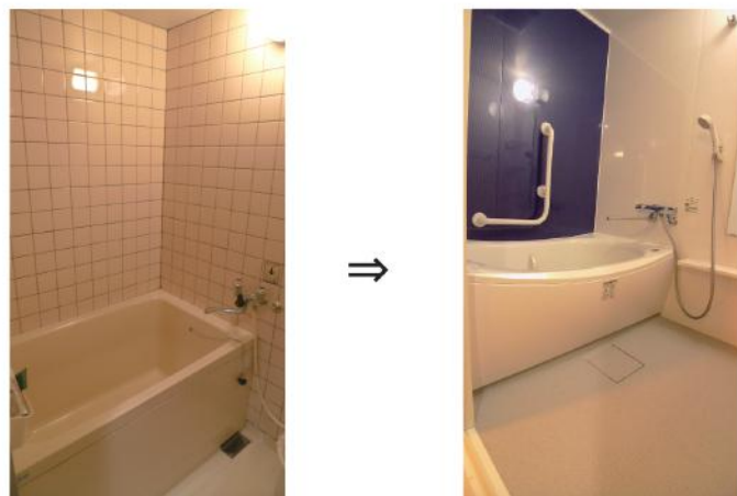
浴室内の手すりの取付