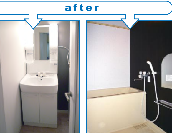
押入れだったスペースを半分 使って洗面台を設置 洗面設備をとりぞき、 広々とした浴室へ改修