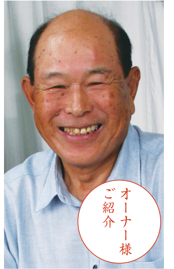
オーナー様ご紹介